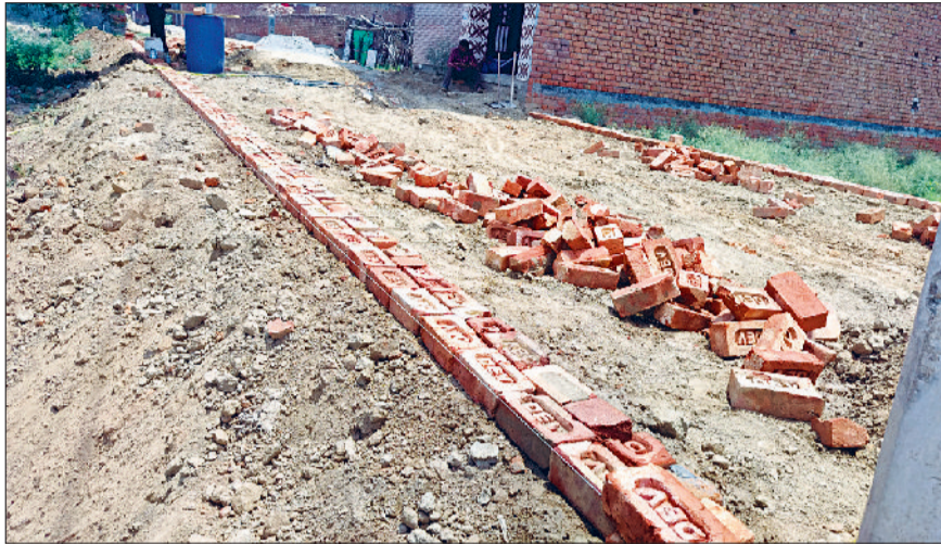
कलायत। कलायत की फकीर पीर कालोनी में जारी इस निर्माण कार्य पर उठ रहे सवाल।