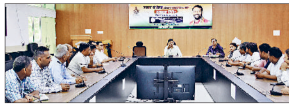
कैथल। एडीसी अधिकारियों की बैठक को संबोधित करते हुए।