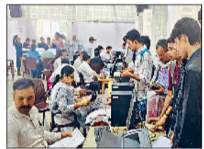
कैथल। कालेज में दाखिला लेते विद्यार्थी।