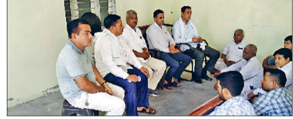
पूडरी। बैठक में भाग लेते हुए कर्मचारी।