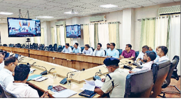
जौद। वीसी में भाग लेते हुए अधिकारी।

जौद। डीसी मोहम्मद इमरान रजा ने रेलवे विभाग के अधिकारियों को सूचना निर्देश देते कहा कि बरसात के दौरान अगर रेलवे अंडरपास में जलभराव होता है तो तुरंत पंप सेट, मोटर चला कर पानी को निकालना सुनिश्चित करें ताकि आमजन को आवागमन करने में परेशानी नहीं हो। देवीनाल चौक स्थित कवर्ड है। परंतु अंडरपास के अंदर लिफ्ट होने के कारण पानी आता है। जिससे जलभराव की समस्या होती है। इन लिफ्ट को तुरंत दुरुस्त किया जाए। रेलवे विभाग जल निकासी हेतु संबंधित स्थान पर कर्मचारियों को इयूटिया लगा कर उसकी सूचना डीसी कार्यालय में भेजना सुनिश्चित करें। रेलवे विभाग के इंजीनियर शैलेश मिश्रा ने डीसी के निर्देशानुसार अंडरपास का दौरा किया और आश्चर्य किया कि जल्द ही लिफ्ट की समस्या को दूर कर दिया जाएगा और जल निकासी हेतु कर्मचारियों की इयूटिया निर्धारित की जाएगी और भविष्य में कभी भी बरसात के दौरान अगर जलभराव होता है तो तुरंत पंप सेट, मोटर लगाकर जल निकासी की व्यवस्था दुरुस्त रखी जाएगी।