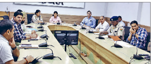
कैथल। डीसी प्रीति अधिकारियों की बैठक को संबोधित करते।