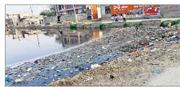
जींद रोड़ राजकीय कन्या प्राथमिक पाठशाला के सामने टूटी सड़क का दृश्य।

सभी केंद्रों को यह निर्देशित किया गया कि वे मेडिकल टर्मिनेशन ऑफ प्रेगनेंसी (एमटीपी) एक्ट 1971 ए संशोधित नियम 2021 के सभी प्रावधानों का पूर्ण रूप से पालन करें। पंजीकरण प्रमाण पत्र को अस्पताल में प्रदर्शित किया जाए। सभी केंद्रों को एमटीपी से संबंधित रिपोर्ट (फॉर्म 1, 3 व रजिस्टर) को विधिपूर्वक तथा अद्यतन रूप से संभारित करने के निर्देश दिए गए। सभी केंद्रों को एमटीपी से निर्देशित किया गया कि वे किसी भी स्थिति में लिंग चयन के आधार पर गर्भपात न करें। इसके उल्लंघन पर पीसी पीएनडी अधिनियम के तहत सख्त कार्यवाही की जाएगी। दो कठोरों के बाद किए गए गर्भपात पर विशेष निगरानी रखी जा रही है तथा चिकित्सकों से स्पष्टीकरण लिया जाएगा। यदि संदिग्ध स्थितियां पाई जाती हैं तो कानूनी कार्यवाही की जाएगी। प्रत्येक गर्भवती महिला की आरसीएचआईडी दर्ज करना अनिवार्य किया गया है। बिना आरसीएचआईडी के गर्भपात की अनुमति नहीं दी जाएगी। रोगी की पहचान, कारण एवं मेडिकल डेटा की गोपनीयता बनाए रखना आवश्यक है। फॉरम एवं रिपोर्ट्स को सुरक्षित एवं सीलबंद तरीके से संभारित किया जाए।