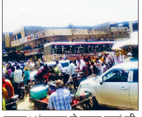
उचाना। अंडरपास से उचाना कलां की तरफ लगे जाम में फंसे वाहन।

लितानी रोड पर बने अंडरपास के दोनों तरफ बुधवार को लगे जाम के चलते वाहन चालकों को परेशानी का सामना करना पड़ा। वाहन जाम के चलते रंग-रंग कर चलते नजर आए। कुछ दूरी तय करने के लिए चालकों को कई-कई देर इंतजार करना पड़ा। पुलिस को जाम की सूचना मिलने के बाद पुलिस कर्मी पहुंचे। यहां काफी मशकत के बाद जाम से वाहन चालकों को राहत मिली। जाम लगने से दुकानदारों की भी परेशानी का सामना करना पड़ा। जाम के चलते ग्राहक भी दुकानों में नहीं आ पा रहे थे। उचाना कलां में भींगा रोड, उचाना खुर्द रोड की