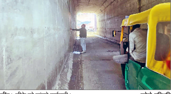
जौद। लीके को जांचते कर्मचारी।