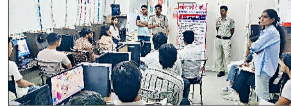
कैथल। युवाओं को जागरूक करते पुलिस कर्मचारी।