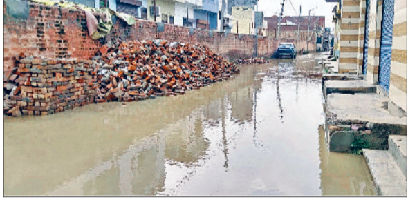
उचाना। मस्जिद वाली गली में भरा बारिश का पानी।